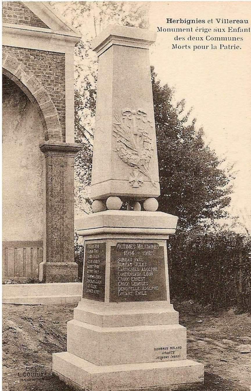
Monument aux morts de Villereau (Briastre©)

Étape n°1 : Se rendre au monument aux morts de la commune.