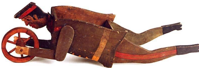
Brouette du soldat allemand