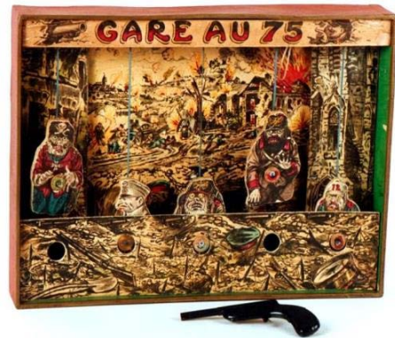
Jeu de tir