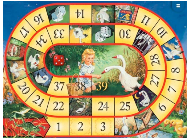
Jeu de l'oie